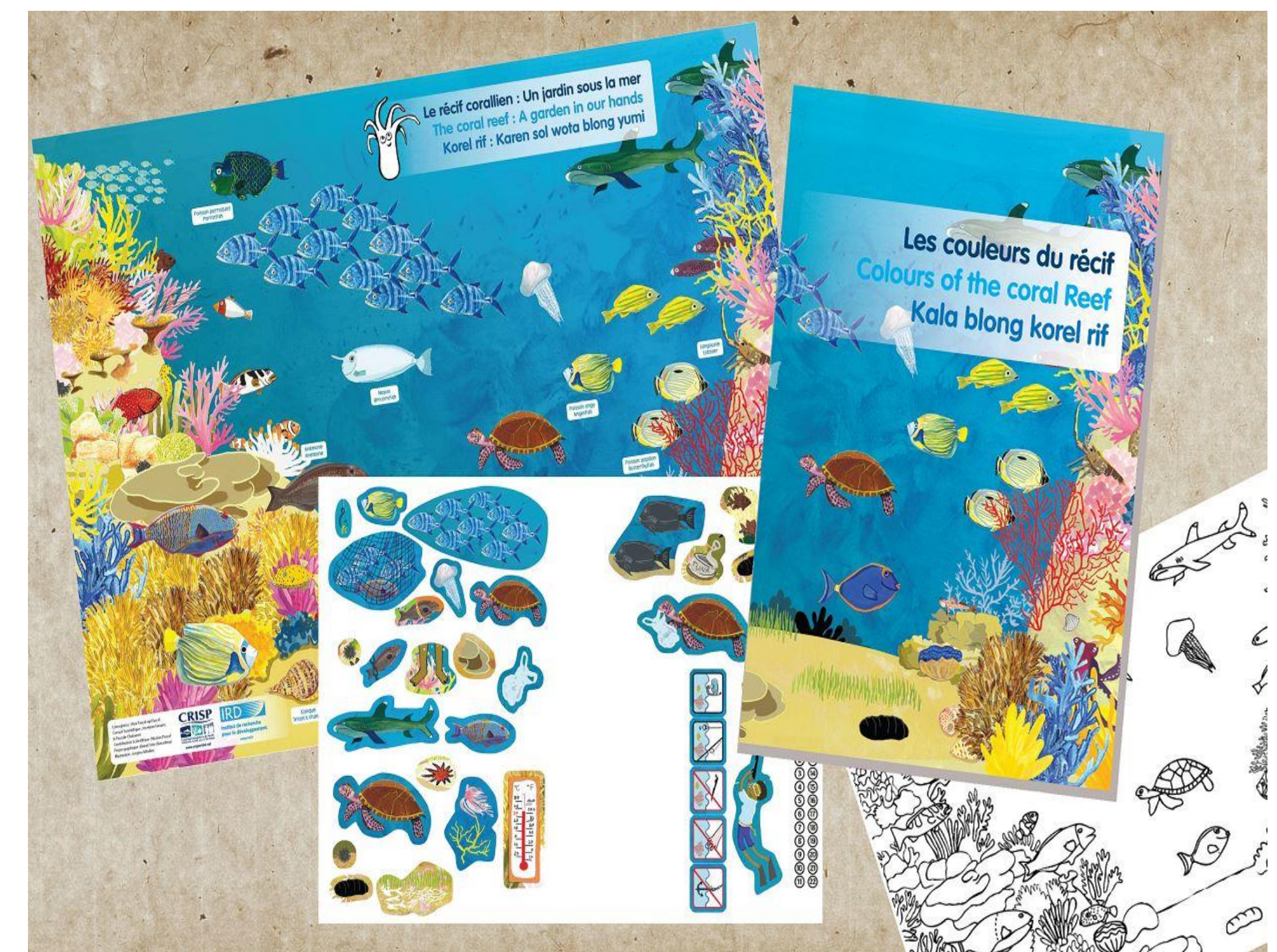
L'album : « Les couleurs du récif »