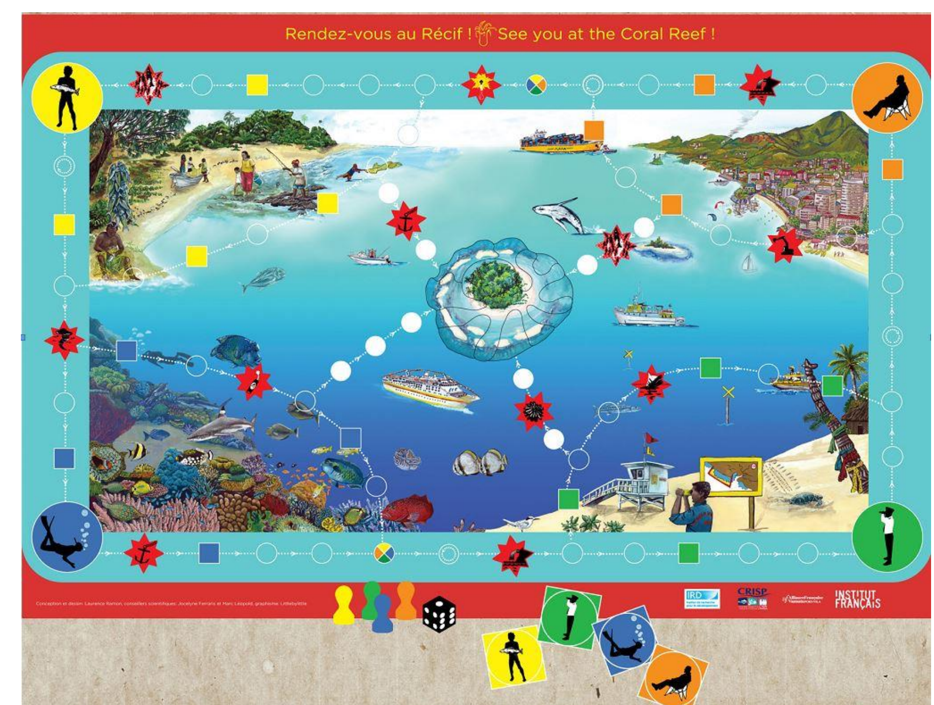
Le jeu de plateau « Rendez-vous au récif »

Connaître et comprendre pour préserver, Informé et éduqué pour modifier les comportements.