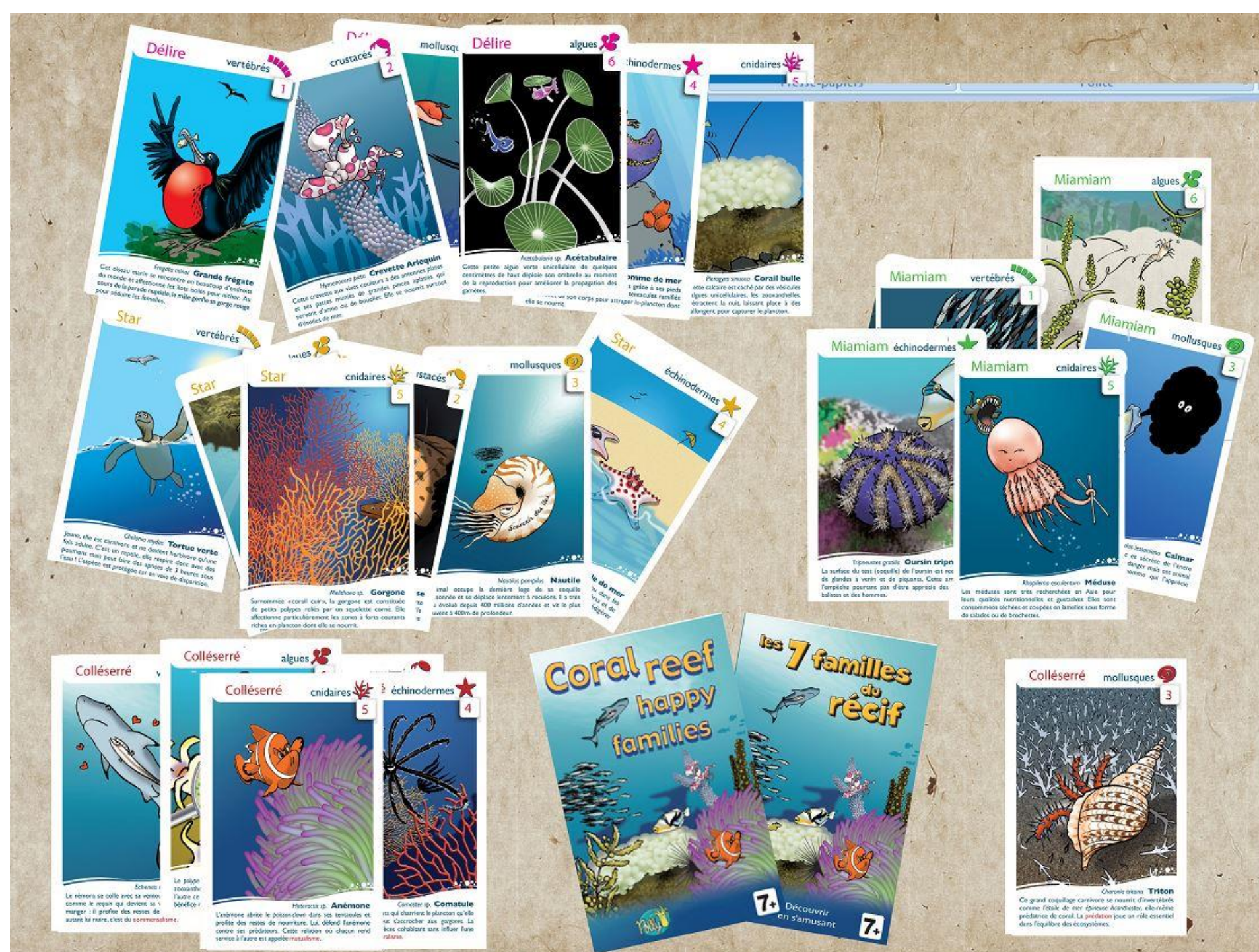
Le jeu des « 7 familles du récif »